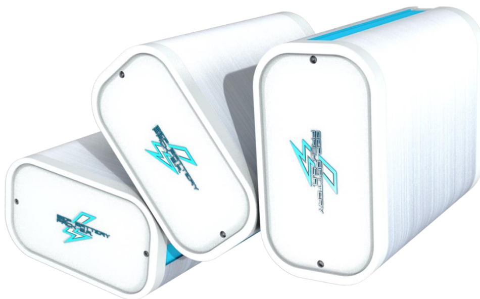
Źródło własne - Biomass Energy Project S.A. Systemy baterii litowych